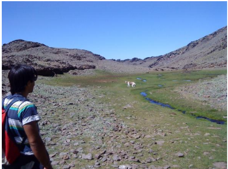
Foto 7: Borreguiles y lagunillos llegando a la Laguna de las Yeguas.

criado les sorprendió una tormenta en la Carigüela del Veleta, un paso natural utilizado antiguamente para la comunicación entre los habitantes de ambas vertientes de la Sierra, y sólo la aparición de la Virgen consiguió aplacar la ventisca. Desde entonces la devoción a la Virgen de las Nieves fue progresiva,