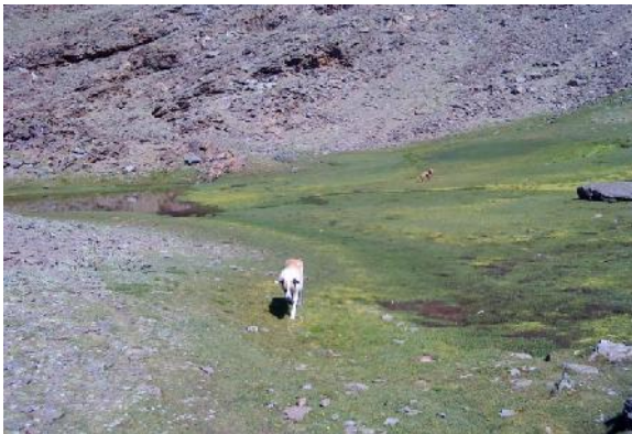
Foto 8: Lagunillos de la Virgen, el verde de los mismos contrasta con la aridez del resto de la montaña.

construyéndose distintas ermitas (sólo queda la del pueblo de Dílar) y celebrando romerías (como la del 5 de agosto en el Mulhacén).