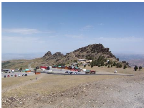
Foto 1: Por los caminos de Málaga. "Peñones de San Francisco y Albergue Universitario", [en línea]. 27 de Junio de 2009, [6 de Septiembre de 2011]. Disponible en la web: http://www.flickr.com/photos/caminosdemalaga/3957281470/

Excursión de alta montaña, de cierta dureza por su altitud y largo recorrido, aunque de enorme interés por su belleza y colorido. Al igual que el itinerario anterior se inicia en la zona de los Albergues (foto 1 y 2), en el Km 35,5, de la carretera a Sierra Nevada, donde aparcaremos el vehículo junto a la valla que impide el paso.