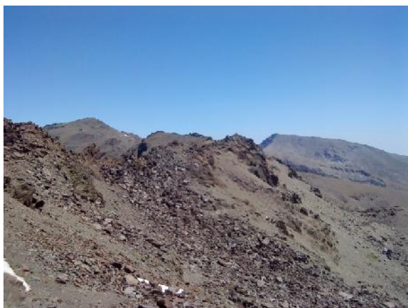
Foto 14: Vistas del Mulhacén y el Veleta desde el refugio del Elorrieta.

En sus alrededores, o incluso por encima de él, se aprecian magníficas panorámicas: al Este, los picos Veleta y Mulhacén (foto 14) , al Oeste la Laguna de Lanjarón y el Pico del Caballo (foto 15), al Norte la ciudad de Granada y la Sierra de Arana (foto 16) y al Sur las Alpujarras y las Costas del Mar Mediterráneo (foto 17).