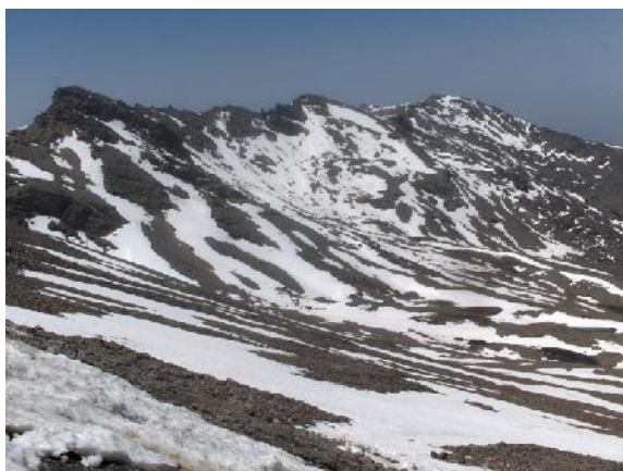
Foto 10: Alemán. "Circular, bonita pero matona, por Sierra Nevada", [en línea]. 23 de Junio de 2008, [7 de Septiembre de 2011]. Disponible en la web: http://www.forospiedrasobrepiedra.com/smf/index.php?topic=4660.0

(3.160 m. alt.), cuyo característico y picudo perfil se recorta sobre el cielo, en la misma divisoria y próximo a un collado en donde está enclavado el Refugio de Elorrieta (3.187 m. alt.).