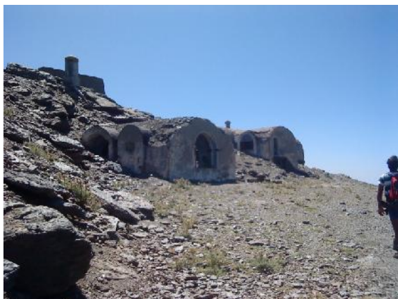
Foto 12: Refugio Elorrieta, imagen de frente cuando llegas por la vereda desde los tajos de la Virgen.

grandes ventanales fueron orientados hacia el Sur (Alpujarras), y los habitáculos prolongados con arcos exteriores hechos a base de trozos de roca. En su parte superior resaltan las chimeneas y una especie de recinto construido con piedra y pizarra, que se utilizó para acumular nieve y posteriormente convertirla en agua.