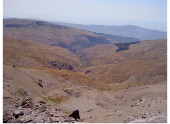
Foto 17: Vistas desde el Elorrieta del barranco de Poqueira y las Alpujarras.

El regreso lo efectuamos por el mismo camino de ida, teniendo ahora de cara Pradollano, el grupo de Albergues y los Peñones de San Francisco .