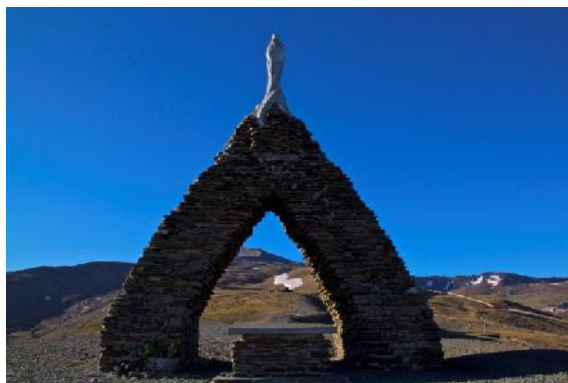
Foto 3: Díaz Somodevilla, Lola. "Virgen de las Nieves", [en línea]. 3 de Agosto de 2011, [7 de Septiembre de 2011]. Disponible en la web: http://www.fotocommunity.es/pc/pc/display/25408562

Nos dirigimos en ascenso hacia el Monumento a la Virgen de las Nieves (foto 3), del escultor granadino López Burgos, por una clara senda que cruza la carretera en repetidas ocasiones. Como fondo y sentido de marcha tendremos el Pico del Veleta. A nuestra izquierda queda el antiguo Observatorio del Mojón del Trigo, continuando hasta el cruce de Cauchiles. De aquí parten dos ramales, uno al Pico del Veleta y Capileira (izquierda), y otro a Borreguiles y al Observatorio-Radiotelescopio (derecha). Este trayecto por carretera nos supondría algo más de 2 kilómetros y por la senda se queda en la