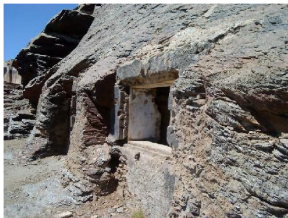
Foto 13: Refugio Elorrieta, parte de atrás con ventana excavada en la roca.

El refugio quedó prácticamente destruido durante la Guerra Civil española, años después se hicieron varios arreglos, al objeto de utilizarlo parcialmente como refugio.