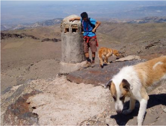
Foto 16: Techo del refugio Elorrieta y vistas a la loma de Dilar y Granada.